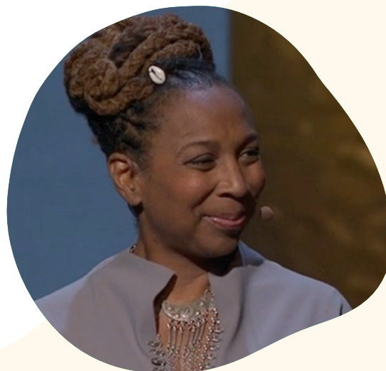
Kimberlé Crenshaw, Militante Américaine des Droits Civiques

Veillez noter : que la vidéo dure environ 19 minutes et présente l'option de la regarder avec des sous titres en français.